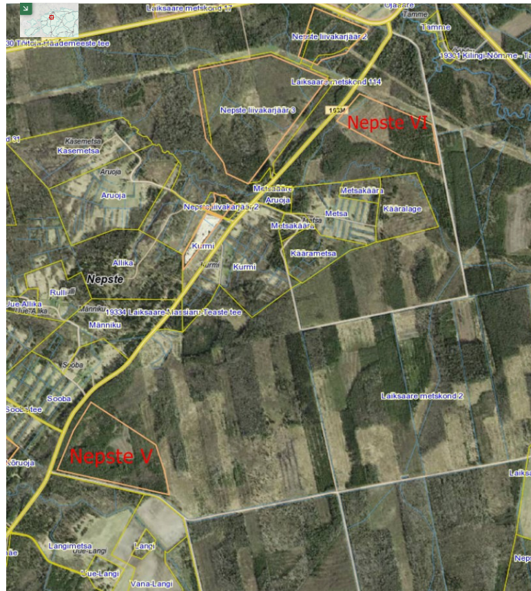
Joonis. Kavandatavate Nepste V ja VI liivakarjääride asukohad.